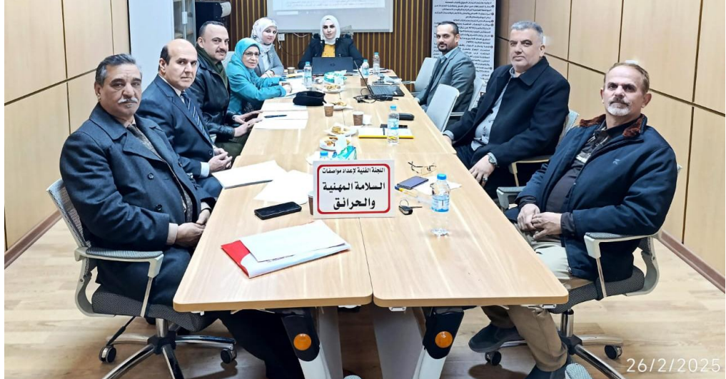
اجتماعات اللجنة الفنية الخاصة بأعداد مواصفات السلامة المهنية والحرائق (ل.ف)