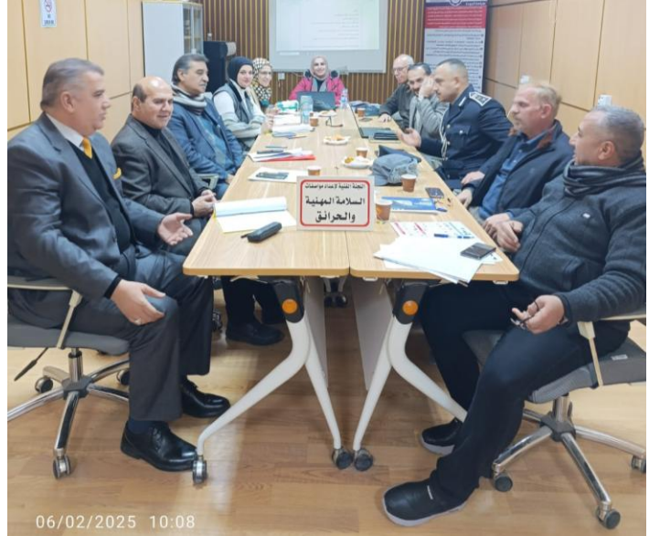
اجتماعات اللجنة الفنية الخاصة بأعداد مواصفات السلامة المهنية والحرائق (ل.ف7)